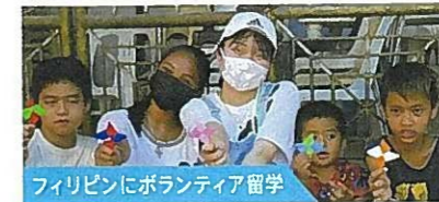
フィリピンにボランティア留学

創造力に富む英国で現代建築のデザインと独特な思考・発想を学ぶ 語学研修と並行し、英国を代表する建築デザイン企業にインターンを行い、フィールドワークを通じて建築の構造とデザインの両面を学びました。