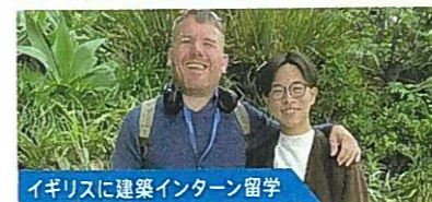
イギリスに建築インターン留学