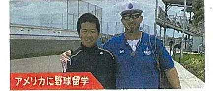
アメリカに野球留学

貧困の実態をこの目で見たい！ 社会課題をグローバル探究 スラム街でのボランティアプログラムに参加し、子供の食事ケアや、日本の折り紙を教えるなどの異文化交流を通じ、教科書では学べない経験をしました。